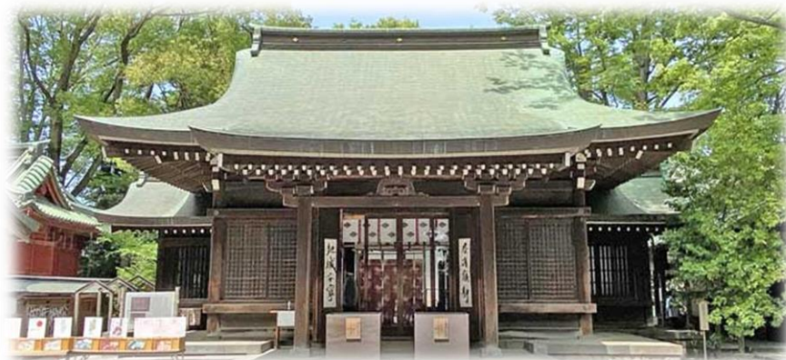
若木育成会千葉県支部主催 研修旅行