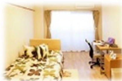
※部屋はイメージです