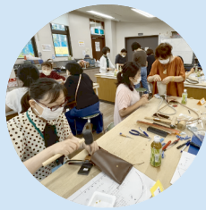
革細工のスマホケース作り