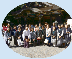
香取神宮正式参拝