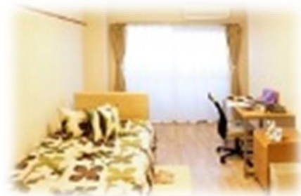
※部屋はイメージです