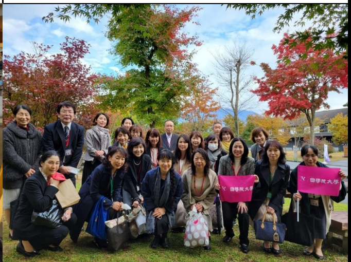
集合写真その2(あさぎりフードパークにて)