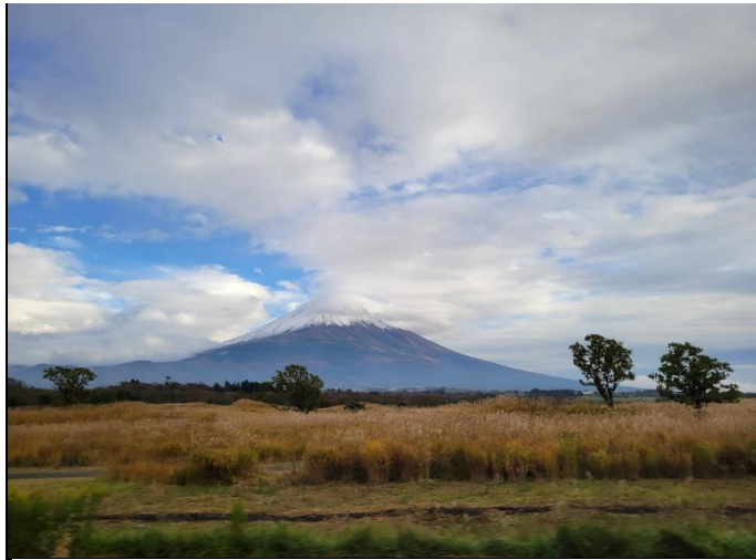
車窓からの富士山が大きく見えました！