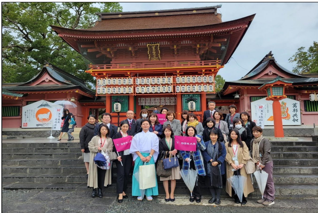
集合写真その1(御殿前にて)