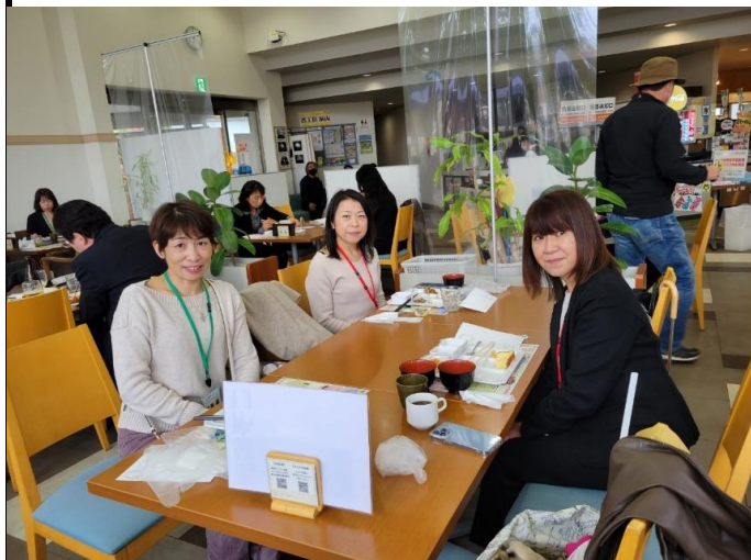
ランチビュッフェ(制限時間60分!!!)