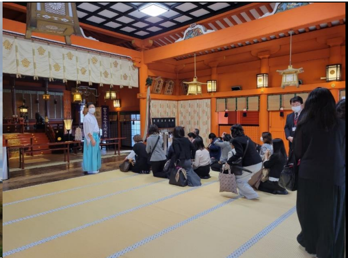
正式参拝が始まります！