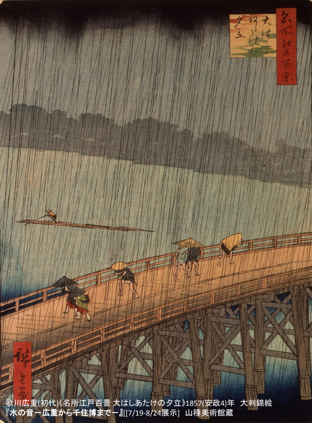
歌川広重(初代)《名所江戸百景 大はしあたけの夕立》1857(安政4)年 大判錦絵 『水の音ー広重から千住博までー』[[7/19-8/24展示] 山種美術館蔵